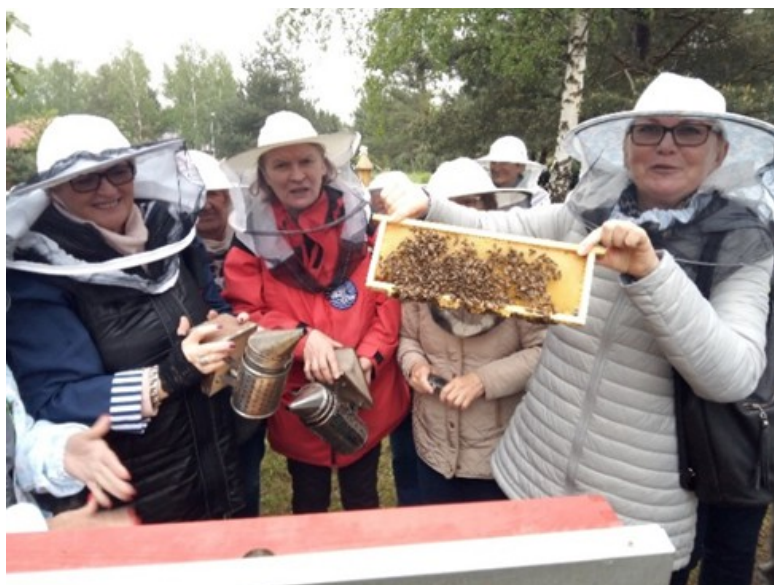
Seniorzy na zajęciach w pasiece „Nasze Pszczoły” w Chotomowie

- wycieczkę: Rejs statkiem po Wiśle, Kanale Królewskim i Zalewie Zegrzyńskim, ze zwiedzaniem Serocka i piknikiem nad zalewem.