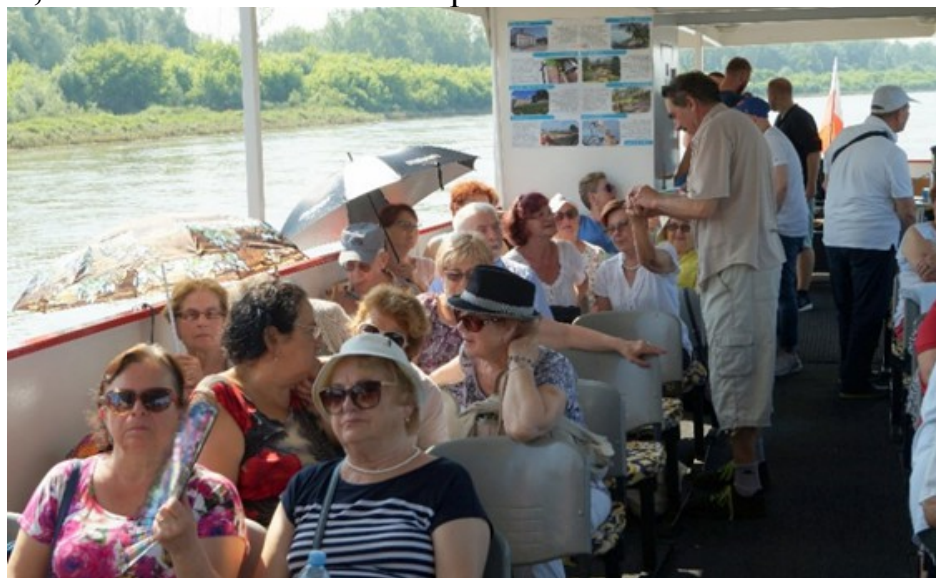
Wycieczka statkiem po Zalewie Zegrzyńskim, do Serocka i Zegrza

- wycieczkę: Rejs statkiem po Wiśle, Kanale Królewskim i Zalewie Zegrzyńskim, ze zwiedzaniem Serocka i piknikiem nad zalewem.