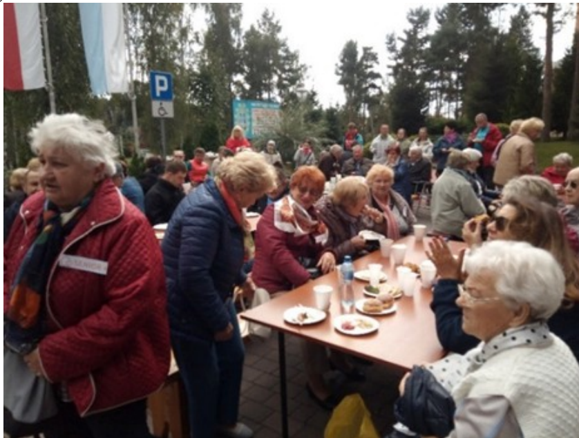
Członkowie Klubu Senior+ na I Spotkaniu Integracyjnym Legionowskich Klubów Seniora

- 19.09.2019 - I Spotkanie Integracyjne Legionowskich Klubów Seniora zorganizowane przez Klub Seniora „AMICUS” przy kościele pw. Matki Boskiej Fatimskiej na Piaskach. Uczestniczyło w nim 15 seniorów z Klubu Senior+;