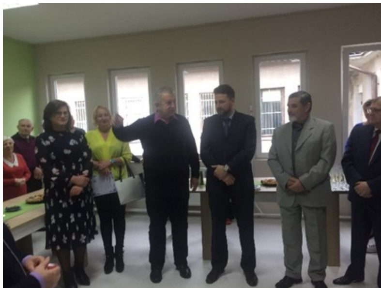
Uroczyste otwarcie legionowskiego Klubu Senior+